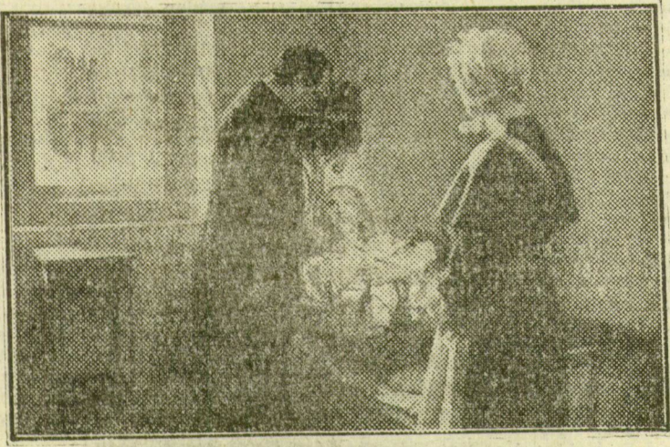
Jelenet a „Semmelweis” című magyar filmből.

A film főszereplője Apáthy Imre, Semmelweis alakítója munkájáról ezt mondja: „Igaz eszméért élni, küzdeni és meghalni: hősi tett. Semmelweis alakjának életrekelése nagy és kivételesen nehéz feladat volt. Semmelweis nemcsak központi, hanem minden kockán jelenlévő alakja a filmnek. Szímszámára nincs szebb feladat, nincs nagyobb öröm, mint az igazi hős