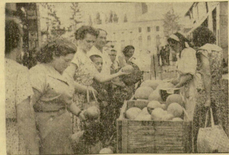
Itt a dinnyeszezon. A kiszolgálás gyorsabbá tétele érdekében csúcsforgalom idején az utcán is folyik az árúsítás a Lenin-utcai Népbolt árúda előtt.