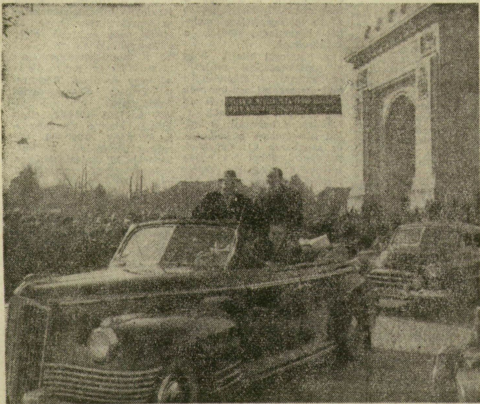
Forró lelkesedéssel fogadták a magyar párt- és kormányküldöttséget Romániában mindenütt. Képfőnkön: nyitott gépkocsiban az ünneplő tömeg sorfala között haladnak el Kádár János, Gheorghiu-Dej és Apró Antal elvtársak