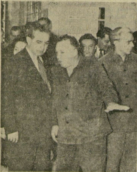
Beszélgetés a munkáról

A többi üzemrészeken is a munka, a család és a ke-