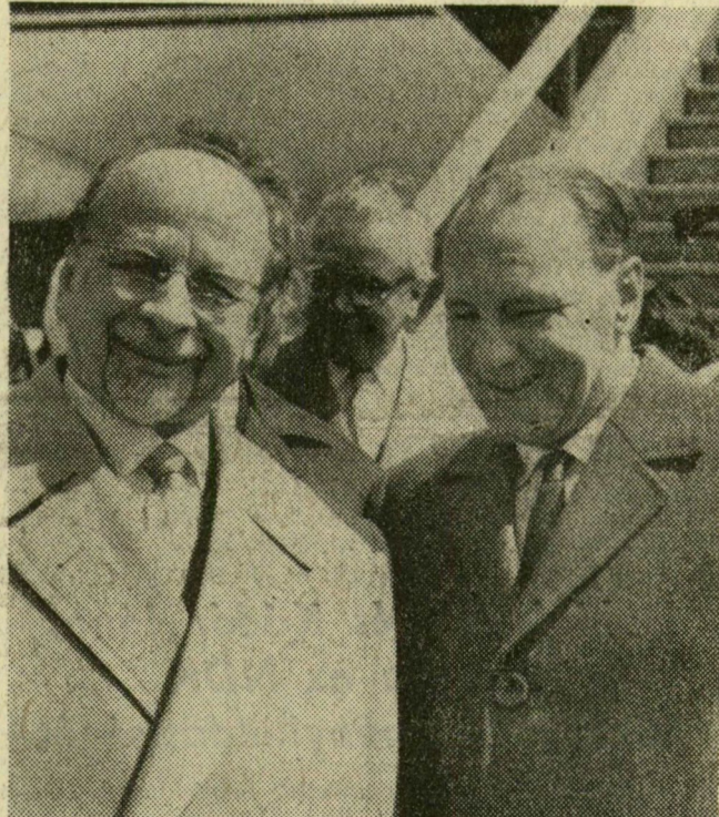
Walter Ulbricht elvtárs Kádár János elvtárral beszélget a repülőgép előtt.

gyarországi látogatása alkalmat nyújt nekünk, hogy közelebbről megmutassuk a szocializmust építő magyar nép életét, építőmunkáját, eredményeit. Küldöttségükkel találkozni fog a magyar dolgozókkal, tárgyalásainkon megvitátjuk az országaink közötti közvetlen kapcsolatok