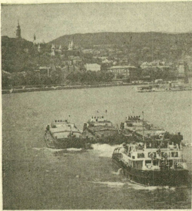
Budapest a hajózás fontos központja, sok hajó megfordul kikötőjében. Képünkön: megterhelt uszályokkal szovjet vontatóhajó halad át a fővárosnak. A kikötőbe sok áru érkezik, és sok árut továbbítanak innen. (Részletes tudósítást lapunk 3. oldalán.)