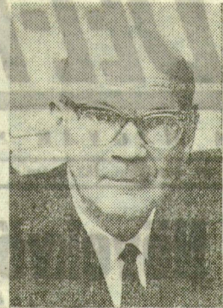
URHO KALEVA KEKKONEN, a Finn Köztársaság elnöke

A finn államelnök nagy híve a közlekedés politikájának: a jó kapcsolatok kiépítésének minden országilag. Jószozszerű, baráti viszonyt igyekszik fenntartani a Szovjetunióval — ez egyébként a mai hivatalos finn külpolitika főbb célkitűzései közé is tartozik. A szocialista országokkal is bővílnék a kapcsolatok, s ez