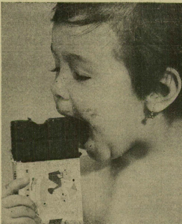
Szeretem a csokit!

A kétnapos tanácskozás Szabó István zárszavával ért véget.