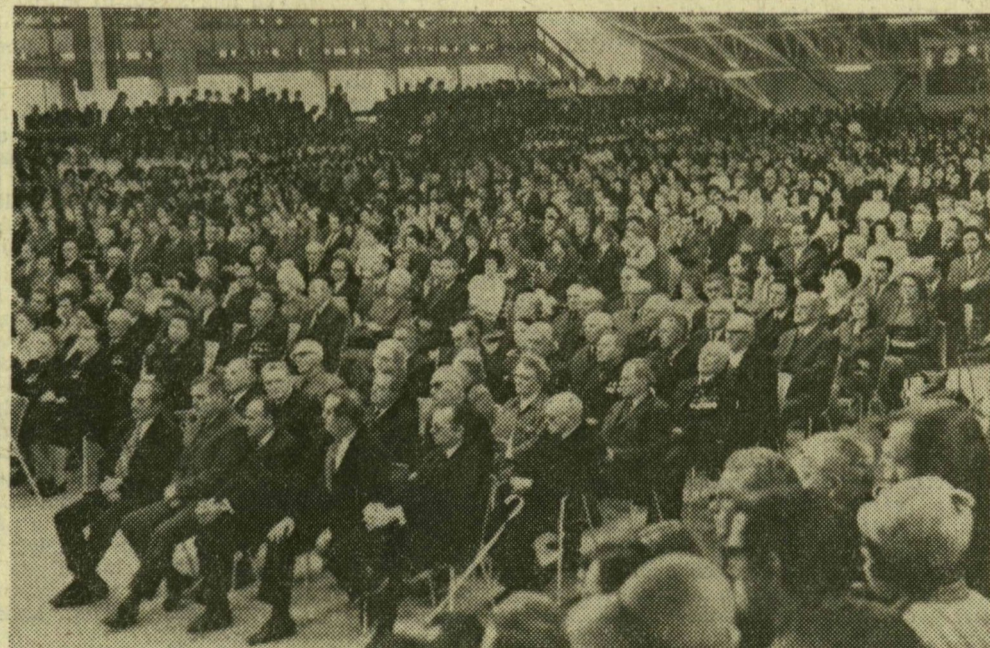
A nagygyűlés résztvevőinek egy csoportja.

Büszkeséggel emlékezünk azokra a honfitársainkra, akik fegyverrel a kézben, a szovjet hadseregben, Európa különböző harcmezőin, vagy hazánk területén partizánként harcoltak a fasiszmus ellen. Azokra az elvtársaink-