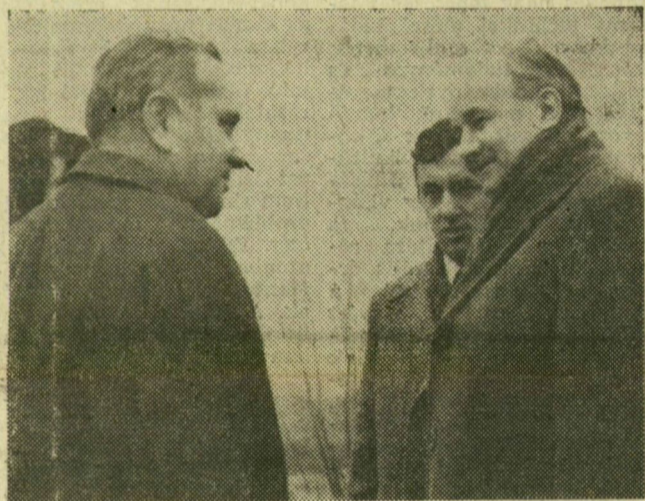
Fogadás a határon