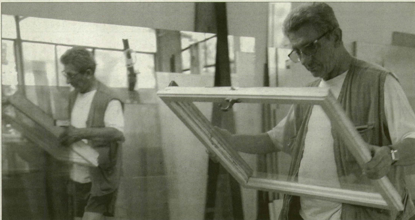
A betört ablaküveget általában még aznap pótolni tudják

Újabb telefonszám, a mester barátságosan hangon szól bele a kagylóba. Azt mondja, információt ad, a nevével viszont nem. Pitiáner zárszöszmötöléssel nem foglalkozik, ha beletörnek a kulcs, keressünk mást. Cserét viszont tud vállalni, augusztus 20-a után, addig be van táblázva. Kiszállási díjat külön nem számol fel, de ötezerrel kezdődik a munkadíja. Ha szükséges,