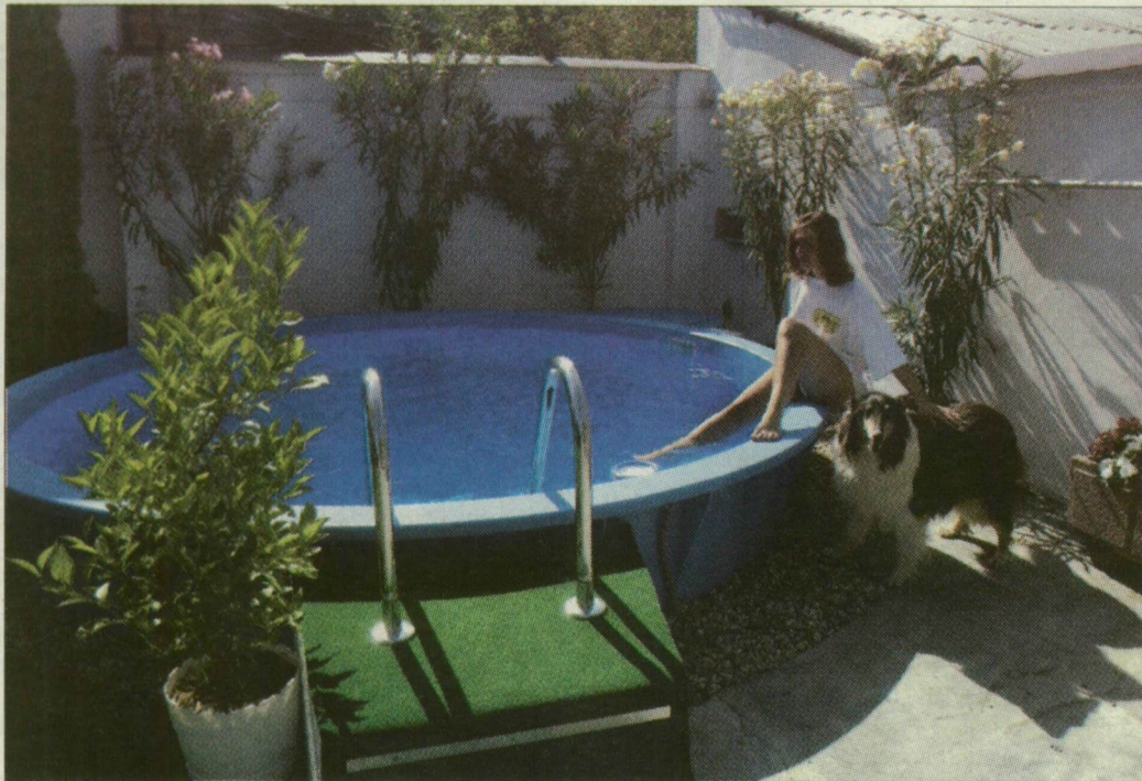
Szerencsés esetben a vásárlás után már másfél nappal megmártózzhatunk a kertben kialakított medencében

A szűrőhomok mindig szükséges kellék (4000 forint 50 kilónként), akárcsak a befűvő (darabja 1770–5500 forint), a polifoam szigetelés (54 ezer forint), vagy a vízforgató berendezés (88–170 ezerért). Az alapgépezet része a szkimmer (a felszíni fölös, 10 ezer 300-tól 27 ezerig). A nyitó vegyszercsomag klórgranulátumot, PH-csökkentőt és algagátlót tartalmaz, 22 ezer forintos áron, de szintén a tisztaságot szolgálja az alpnak tekinthető porszívószett, 24 ezerért. Az alapgépezet egyébként megúszható egy-másfél millió forintból, amiben nincs benne föld- és betonmunka ára, valamint a medenceépítés