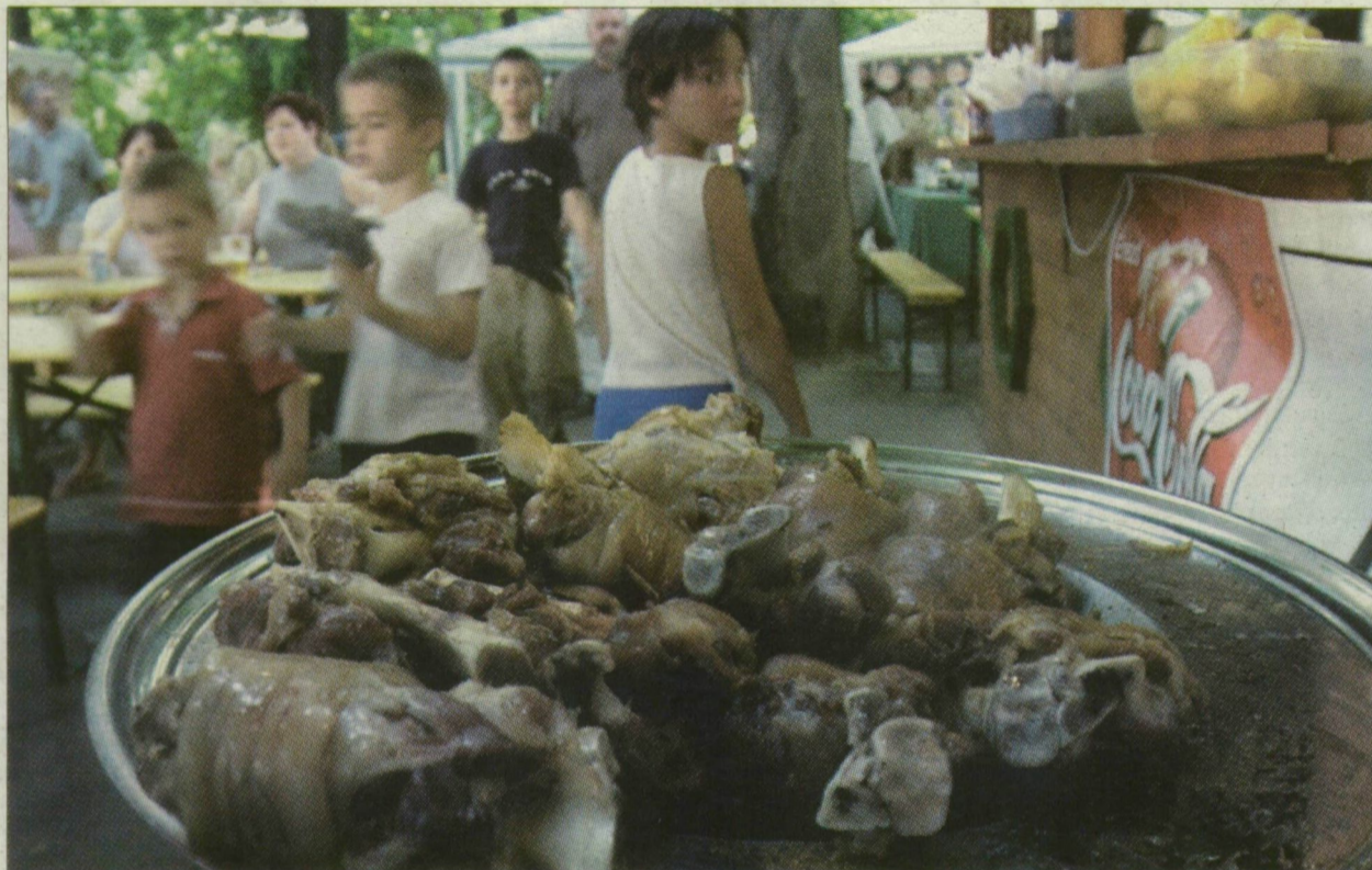
A nyári hónapokban fokozottan ügyelni kell az ételek higiéniájára

– Bár a szalmonellafertőzés a májustól szeptemberig tartó nyári idő-