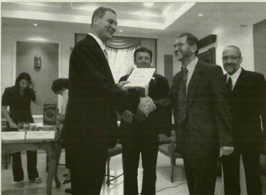
A polgármesternek sikerült megállapodni a csatornaépítő partnerekkel.

Az Európai Unió ISPA alapjának támogatásával megvalósuló építkezések a Szegeddel szomszédos településekre